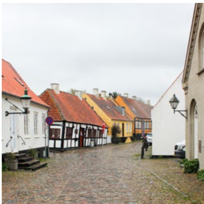
Overgade med kig mod den gamle tolbod på Overgade 23 på hjørnet af Kurveleddet, opført som beboelse i slutningen af 1600-tallet, fredet.

Det er dog ikke mindst antallet af bindingsværkshuse der giver Ebeltoft midtby en særlig karakter. Disse huse er overvejende opført i én etage og kan tidsmæssigt deles op i en ældre og en yngre gruppe. De ældste bevarede bindingsværkshuse stammer fra 1600-tallets slutning og 1700-tallets begyndelse. De yngre er fra perioden ca. 1800 til 1900."