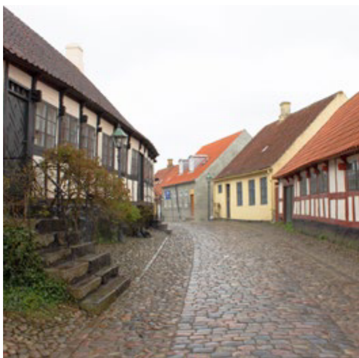
Bindingsværk og gadebelægninger med bro- og pigsten understøtter det helstøbte kulturmiljø i Ebeltoft. Tv. i billedet Overgade 5-9 fra 1850. Th. i billedet ses den gamle postlade fra omkring år 1700, begge fredet.

Også byens smukt bearbejdede overflader som gadebelægninger, facader og tagflader er værdifulde for kulturmiljøet – heriblandt variationen mellem det markante bindingsværk og de pudsede facader i forskellige farver, kalkede overflader, de høje sorttjærede sokler, de mange røde tegltage og ikke mindst de taktile brostens- og pigstensbelægninger, som strækker sig gennem stort set hele den historiske bymidte som et stort sammenhængende tæppe. Sammen med detaljer som de diskrete ældre gadelamper er det hele med til at skabe et stærkt helhedspræg i bymiljøet.