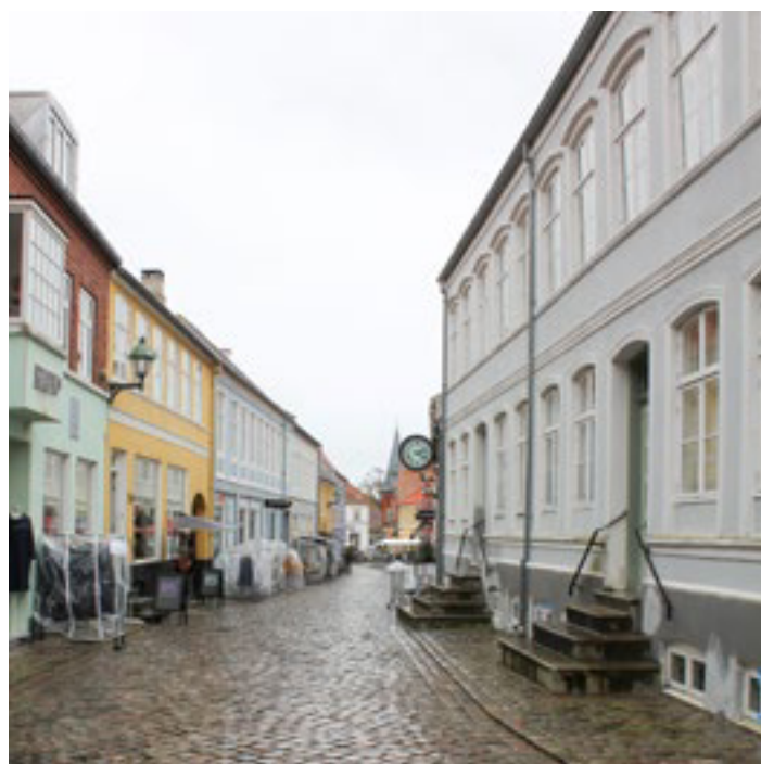
Grundmuret forhus i 14 fag til højre i billedet - del af en tidligere købmandsgård, Adelgade 39-41, opført 1854, fredet.