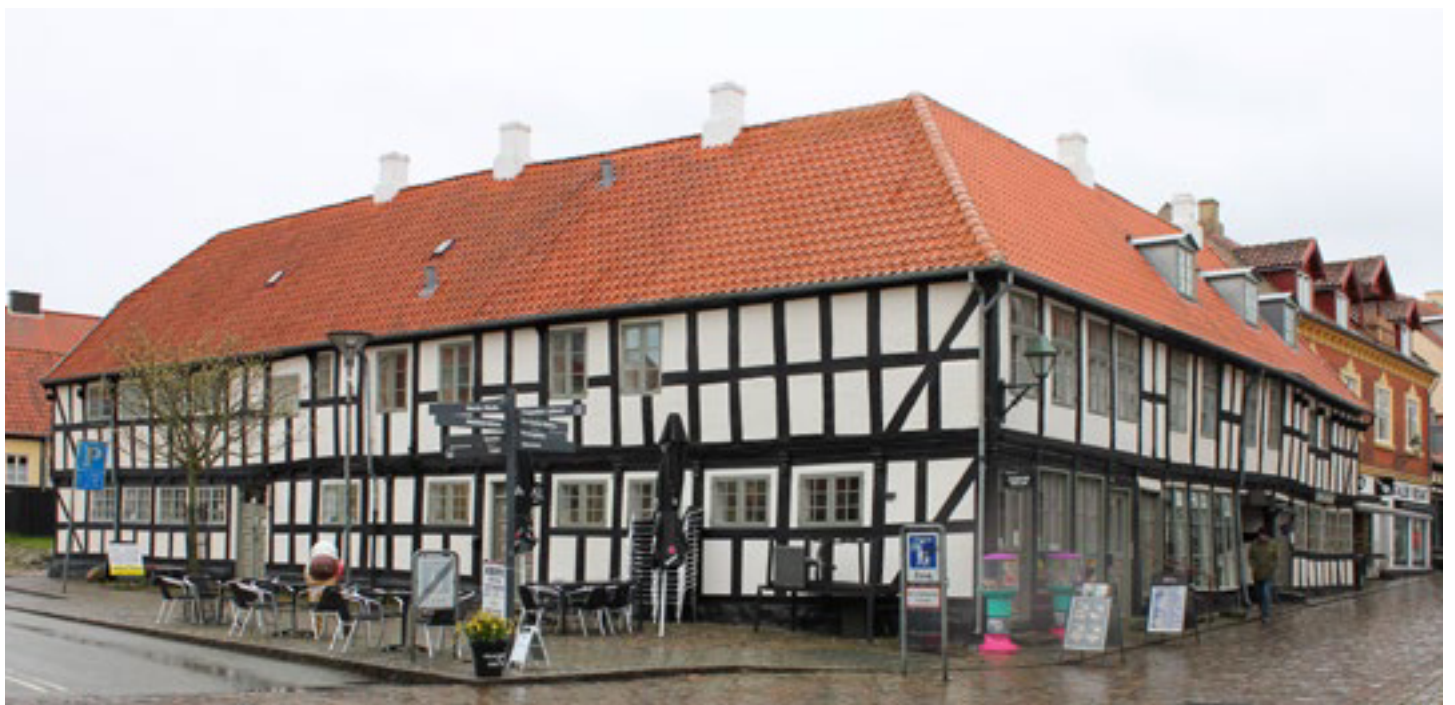
Sigvard Rasmussens Gård, Adelgade 28-32, opført og udbygget mellem 1600- og 1800-tallet, fredet.