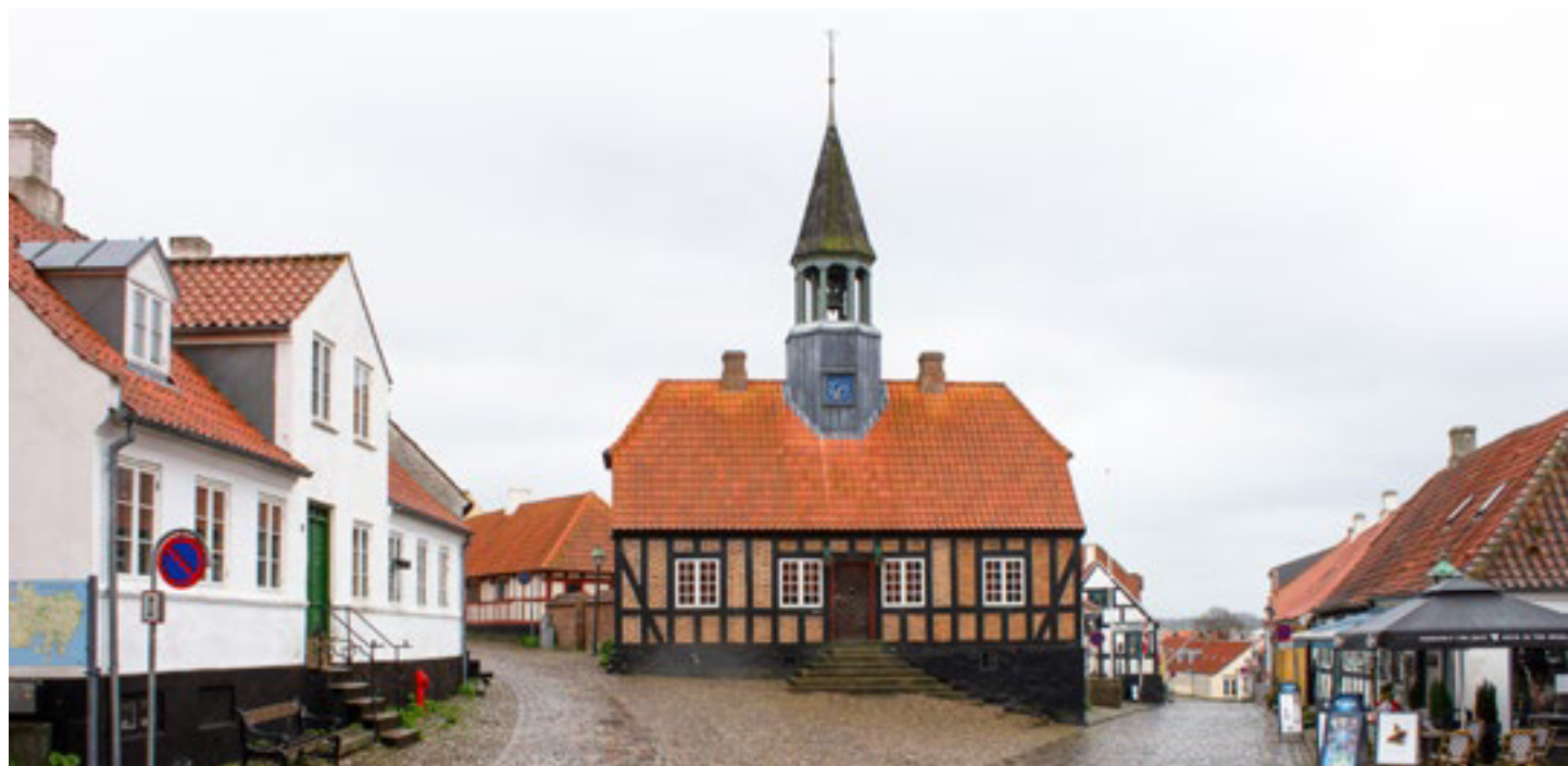
Torvet med det gamle rådhus fra 1789 og hovedgaden, der deler sig i Overgade til venstre og Nedergade til højre for rådhuset.