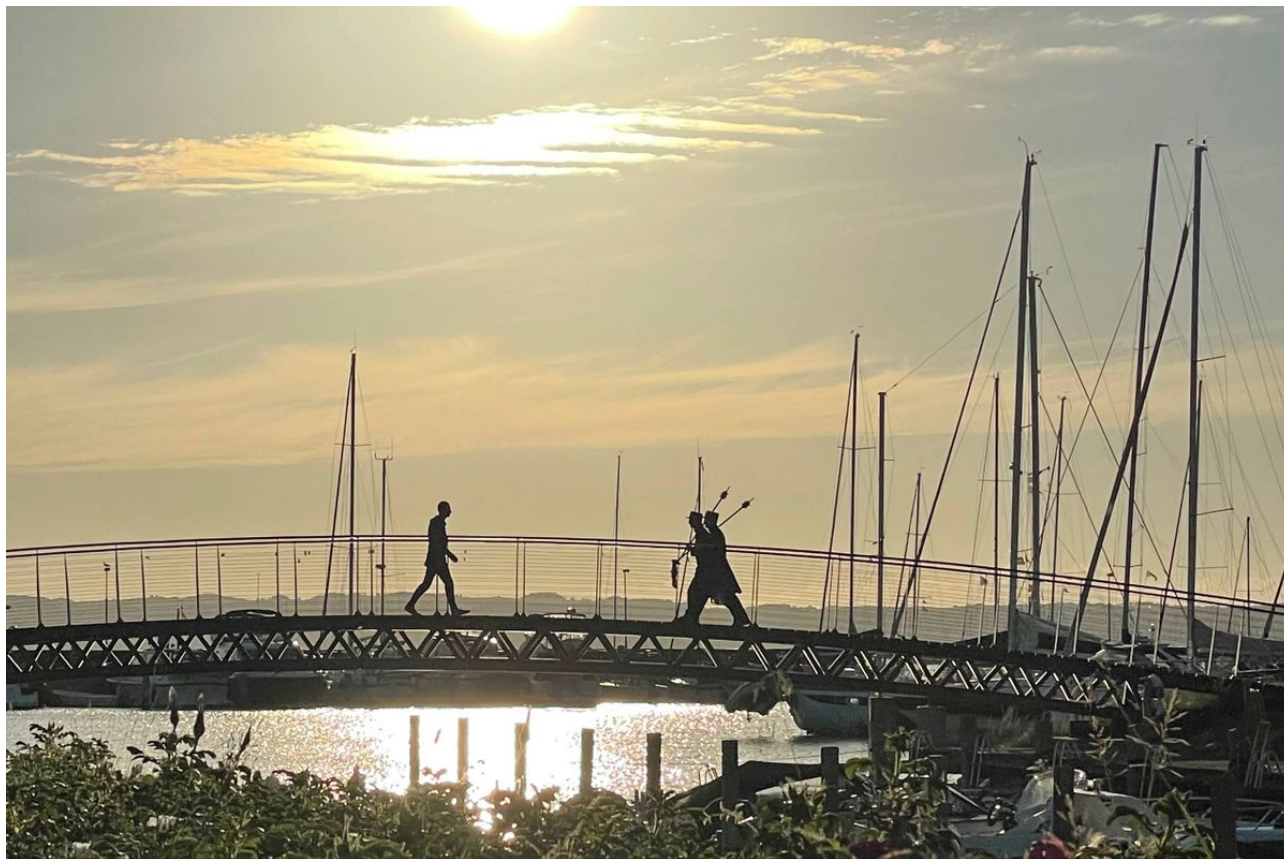
HAVNEN SKAL BINDES BEDRE SAMMEN MED RESTEN AF BYEN.

Et stort ønske fra borgerne og Ebeltoft i Udvikling har været en bynær strand. Den løsning har BOGL dog ikke taget med i sit forslag.