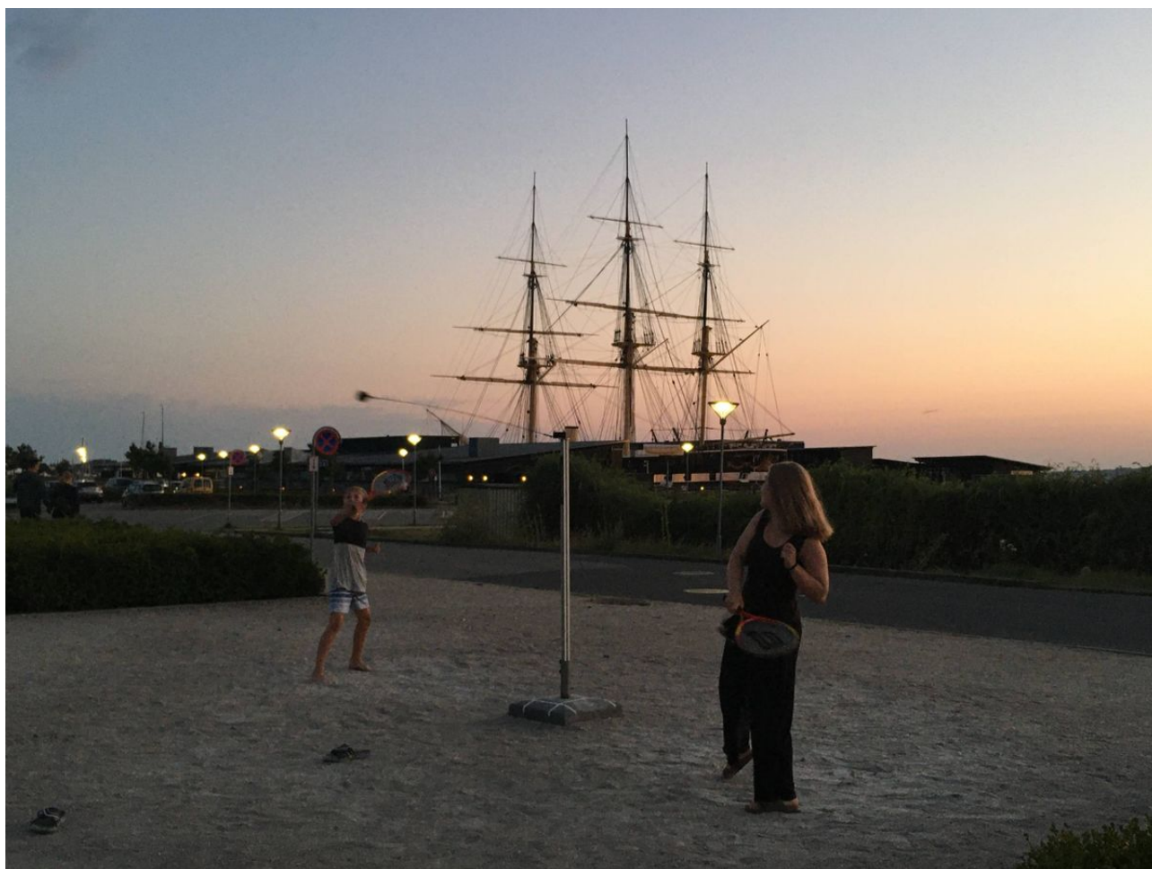
OMRÅDET I FORLÆNGELSE MALTFABRIKKEN OG FORAN FREGATTEN KOMMER TIL AT SE ANDERLEDES UD.

»Der er jo tre grunde i det område, og her er det oplagt at blande boliger, erhverv, butiksliv og måske startupvirksomheder. Vi opfordrer til, at man ikke bygger for højt, men små byhuse og værkstedslokaler, som taler sammen med havnens erhverv. Det kunne være sjovt at tænke i alternative byggematerialer, for eksempel tang.«