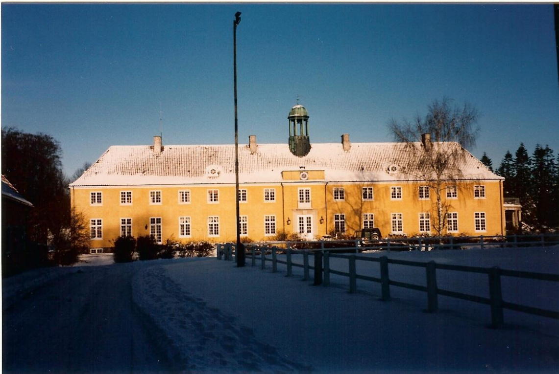
Møllerups hovedbygning, foto 1998. Ridebanen i forgrunden til højre, hestestalden til venstre. Uden for billedet, til højre, ligger den tidligere Hubertus-kro, der oprindeligt var bygget som studestald.